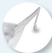
Protección lateral integrada en la montura.