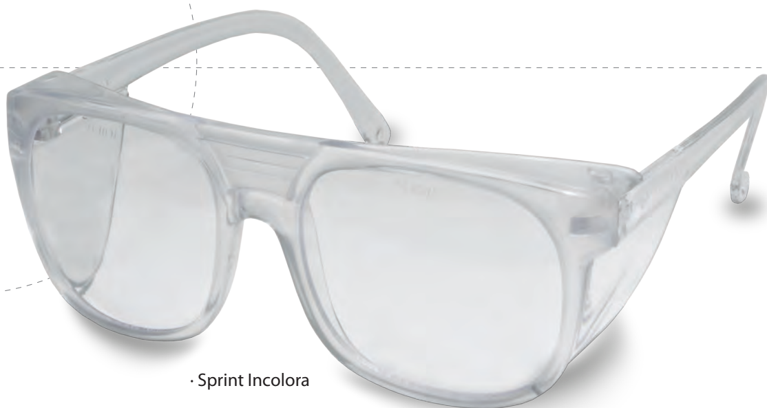
· Sprint Incolora