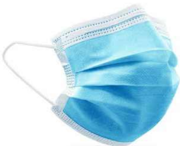
AZUL CELESTE 09001